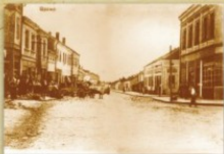
Део главне улице код кафане "Европа", снимак између два рата