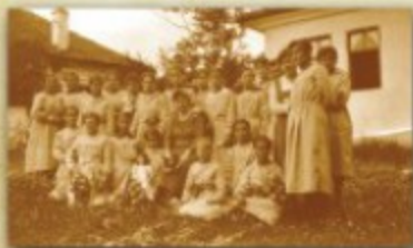
Девојчице Америчанског васпитног дома за српску ратну сирочад, синмај између два рата