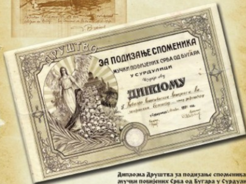
Диплома Друштва за подизање споменика мучци побивених Срба од Бугара у Сурадулици за време Првог светског рата издао Њољачко, поткивалачко, динарско и вазанијско еснафу - члану добротвору, 7. новембар 1922. г. (Збирка Барна)