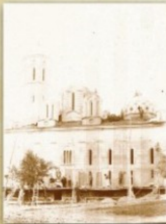
Манастир Свети Прохор Пчињски, реставрација, снимак с почетка 20. века

Инвентар непокретног имања Саборне цркве Свете Тројице у Брању. 31. децембар 1911. г.