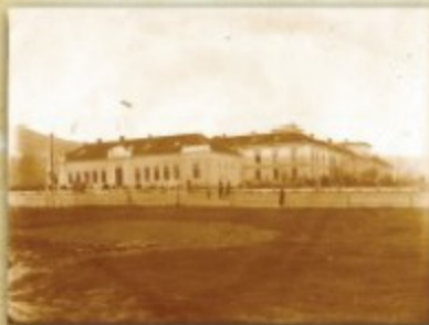
Казарна Првог пешадијског пука "Бњаз Милош Вељки", снимак између два рата