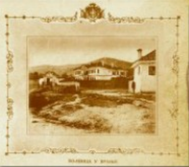
Суајеман бегов сарај, прка водовица у Брању, сниман из 1879. г.