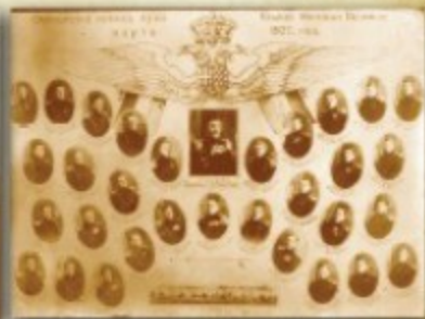
Официри Првог пешадијског пука "Бњаз Милош Вељки", снимак из 1927. г.