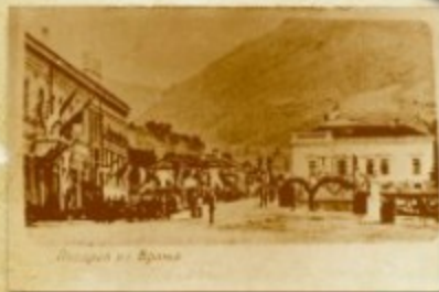
Дочек њихових Величанстава Краља Александара и Драге Обреновић, 30. септембар 1902. г.