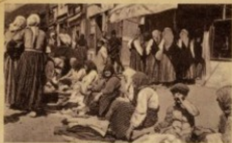
Женска пијаца, снимак с почетка 20. века