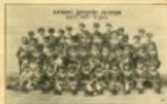
Девојчице Америчанског васпитног дома за српску ратну сирочад, синмај између два рата