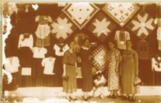
Изложба женских радова, снимак између два рата.