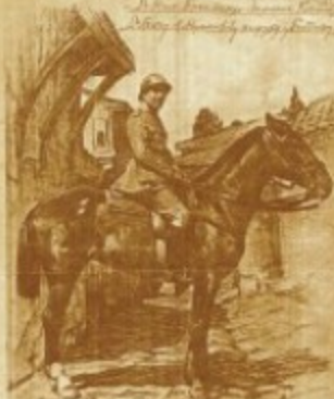
Сувенир са Совањског фронта у знак пријатељства између Француског и српског хирурга 1916-1917. г.