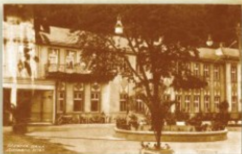
Државни хотел у Крањској Бани са дограђеним спратом, снимак након 1929. г.